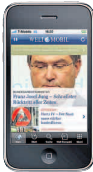
So starten Sie in die WELTApp: Aktuelle Informationen von WELT ONLINE, Kommentare und Hintergründe

– Fußball-Liveticker mit Push-Alarm, je nachdem, welche Vereine der Ersten und Zweiten Bundesliga Sie interessieren. – Über einen individuell einstellbaren Wecker können Sie sich mit frei wählbarer Musik aus Ihrer iTunes-Bibliothek und den neuesten Nachrichten von WELT ONLINE wecken lassen. Sollten Sie Fragen oder Anregungen, Lob oder Kritik haben, schreiben Sie uns unter welt-app@welt.de .