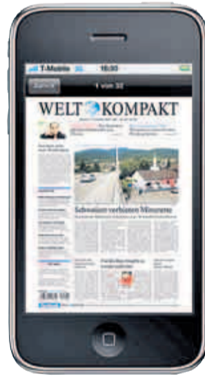
Lesen Sie heute Abend schon die WELT KOMPAKT von morgen. Alle Seiten zum Blättern, alle Artikel bestens lesbar