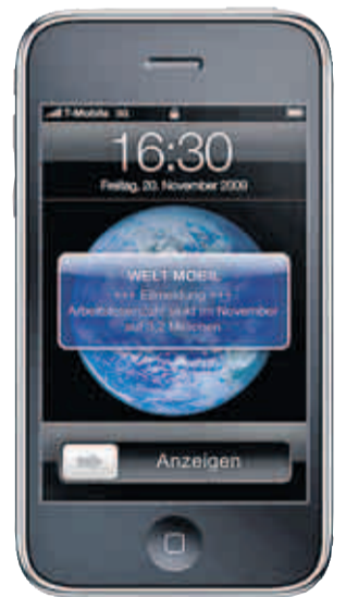
Eilmeldungen schicken wir direkt auf den Screen Ihres iPhones