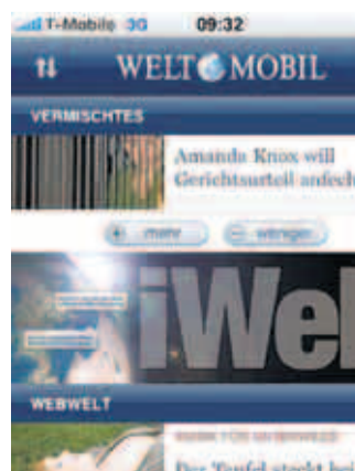
Willkommen in der iWELT: Hier geht es zu Inhalten, die es ausschließlich auf der WELTApp gibt