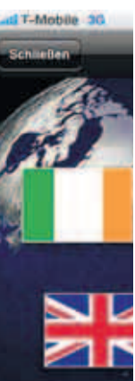
Hier finden Sie mit Informationen der Welt