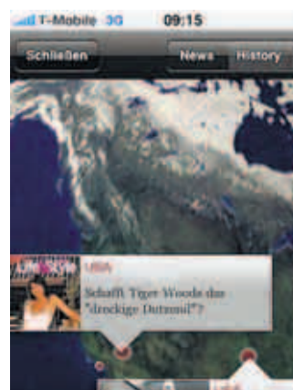
Unsere Korrespondenten berichten aus aller Welt exklusiv für die WELTApp